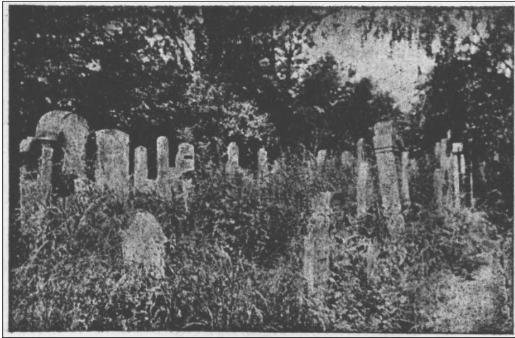
Photographie 1 : Cimetière de guerre n° 387 avant de rangement (en. 1934).

pulation juive. 33 Bientôt il y avait lieu des attaques contre les combattants juifs. A la fin des années 1930 à Cracovie on a dévasté une tombe de combattant. Cet acte a été qualifié comme un acte de banditisme. Les membres de l'Union ont déposé une interpellation dans laquelle ils ont appelé de traiter de même manière tous les combattants indépendamment de la religion ou de la nationalité. 34 Mais, cette interpellation était sans résultat.