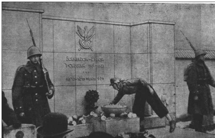
Photographie 6 : Monument (1937).