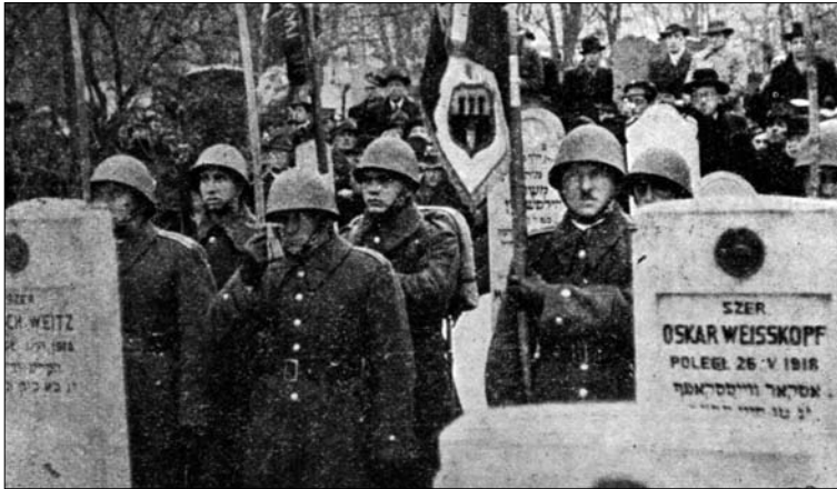
Photographie 3 : Les stèles (14 novembre 1937).

Il avait aussi deux escaliers. On voudrait placer les trois tableaux avec les inscriptions sur le fronton du monument, et, sur le champ d'une dalle de pierre. Les plaques dans les panneaux auront avoir les inscriptions en hébreu. 47 Le monument va avoir la forme semi-circulaire stylisée de maceva . Sur le relief va être la menorah flanquée des deux lions, la couronne de Torah, l'aiguière des Lévites et la geste de bénédiction des Cohanim et l'étoile David. En accord avec le projet de Hans Mayr on va placer deux saules pleureurs (souvent ces arbres se trouvaient sur les cimetières de la Première Guerre mondiale). 48