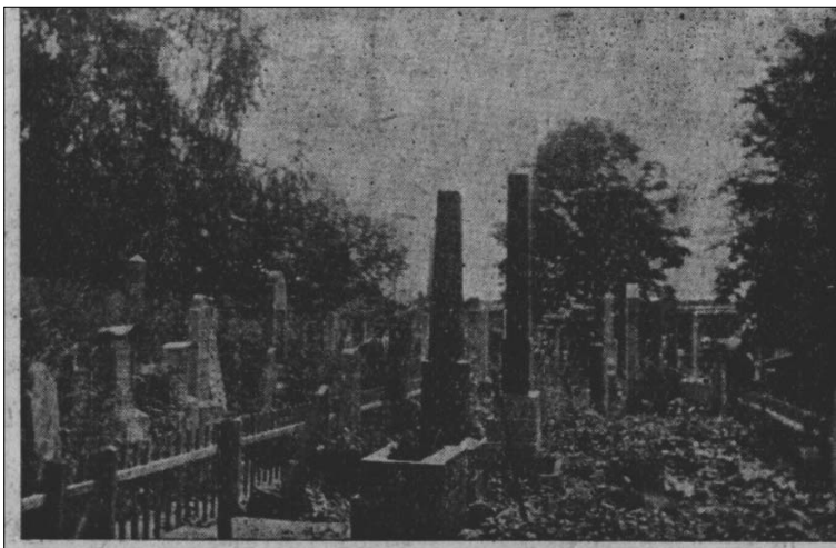
Photographie 2 : Cimetière de guerre n° 387 après le nettoyage (1935).

En 1937, au mois d'avril, on a commencé les travaux communs. 41 En juillet de 1937 on a mis la vente aux enchères pour les travaux de construction autour de muraille. 42