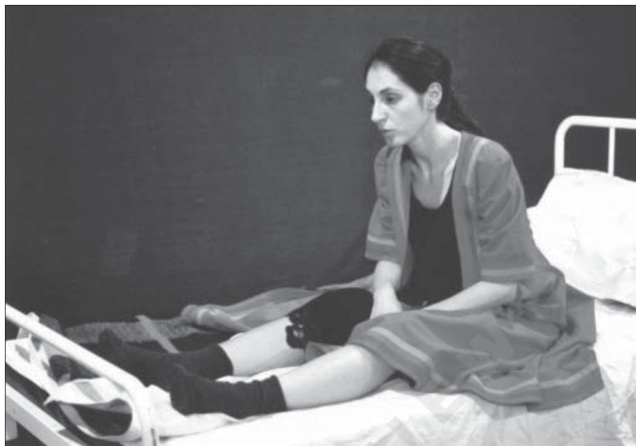
Fot. 1. L. Scheuermann Hodak, Slike Marijine , reż. S. Špišić, HNK Osijek, 2004.