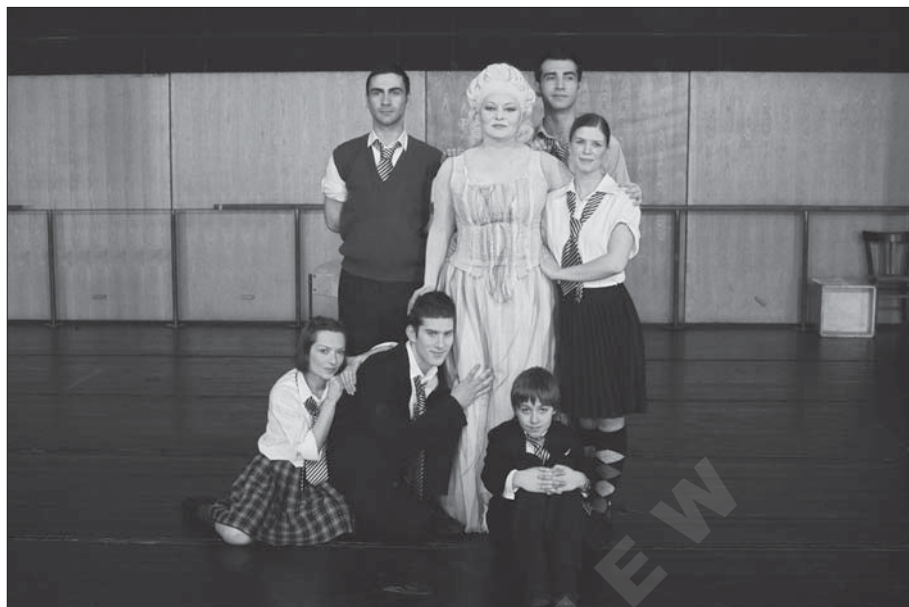
Fot. 3. I. Sajko, Medeja/Žena-bomba/Europa , reż. I. Sajko, D. Ruždjak-Podolski, F. Perković-Gamulin, ZeKaeM, Zagreb 2007.