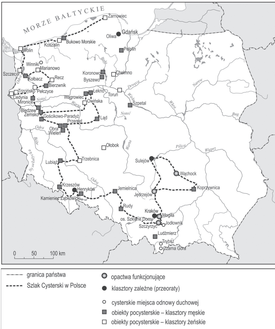
Ryc. 1. Obiekty cysterskie i pocysterskie w Polsce

ródło: opracowanie własne na podstawie danych ze strony internetowej www. 2.