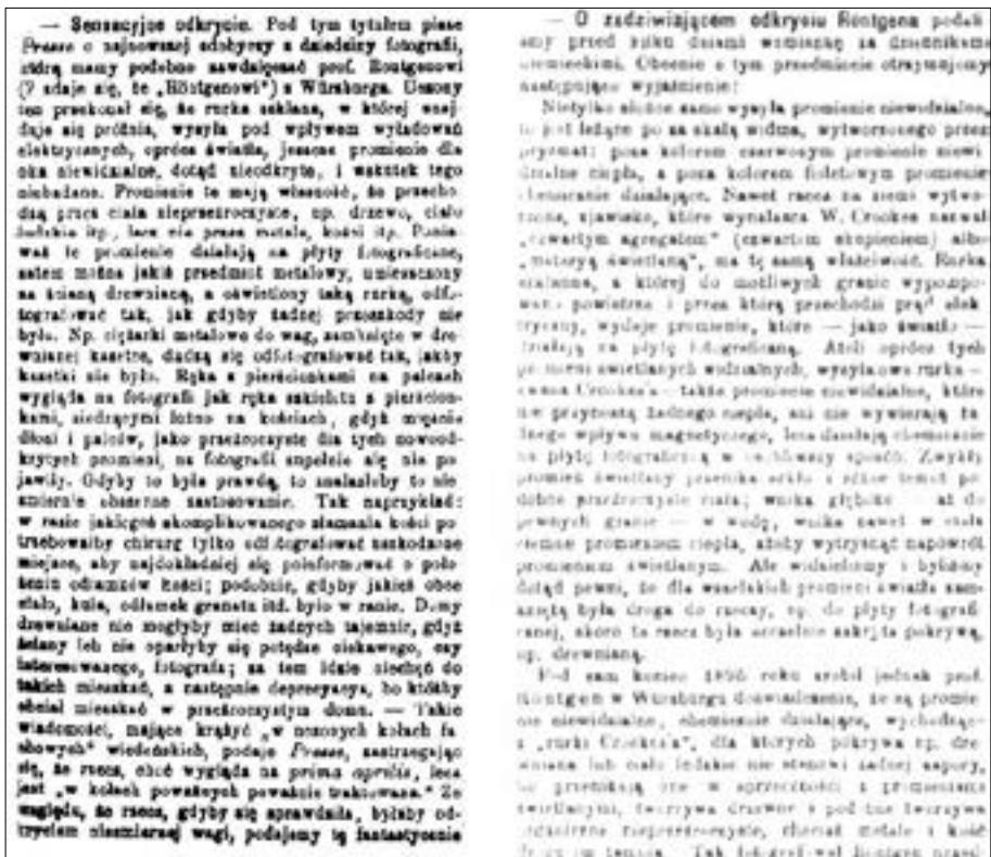
Il. 1. Artykuły zamieszczone w dzienniku „Czas” z 8, 12 i 21 stycznia 1896 roku.

neta wytwarzające niskonapięciowy prąd stały. Całość uzupełniał induktor Ruhmkorffa będący połączeniem transformatora i iskrownika. Dzięki temu urządzeniu ze źródła prądu stałego uzyskiwano prąd zmienny o wysokim napięciu i częstotliwości od kilku do kilkunastu herców. Zestaw ten wykonano w pracowni Olszewskiego we własnym zakresie.