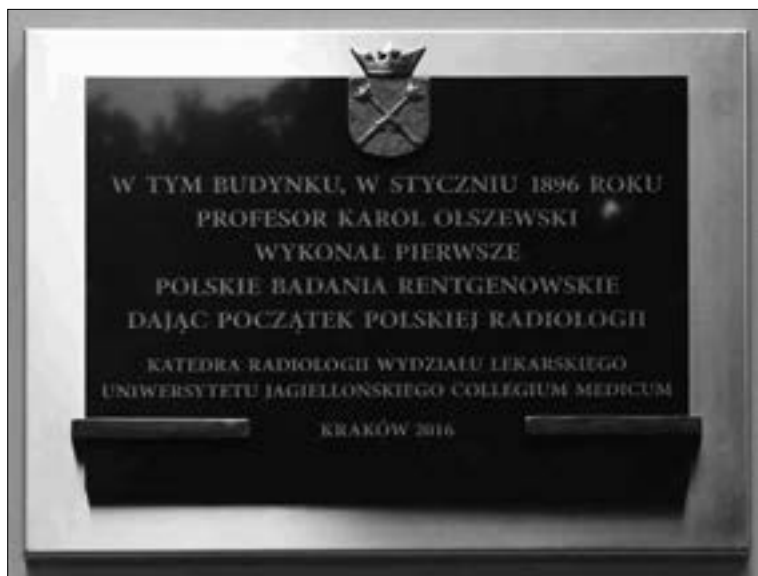
Il. 10. Tablica upamiętniająca wykonanie pierwszych polskich zdjęć rentgenowskich przez Karola Olszewskiego.

nia dwóch lamp rtg 48 . Na posiedzeniu Lekarskiego Towarzystwa Krakowskiego, które odbyło się 4 lutego 1914 roku, zreferował kilka zagadnień związanych z rentgenodiagnostyką, wśród których najistotniejsze było przedstawienie nowatorskiej, odkrytej przez siebie metody uzyskiwania ostrego obrazu serca z zacieraniem struktur sąsiadujących tkanek. W wykładzie zaprezentował metodę otrzymywania obrazów zgodnie z zasadami, na jakich później oparła się tomografia rentgenowska 49 . Zagadnienie to przedstawił również w lipcu 1914 roku na II Zjeździe Internistów Polskich we Lwowie 50 . Opis wynalezionej przez Mayera techniki tomografii został opublikowany w wydanej w 1916 roku w Krakowie monografii pt. Radiologiczne rozpoznanie różniczkowe chorób serca i aorty . Egzemplarz pracy znajduje się w Bibliotece Jagiellońskiej 51 (il. 9).