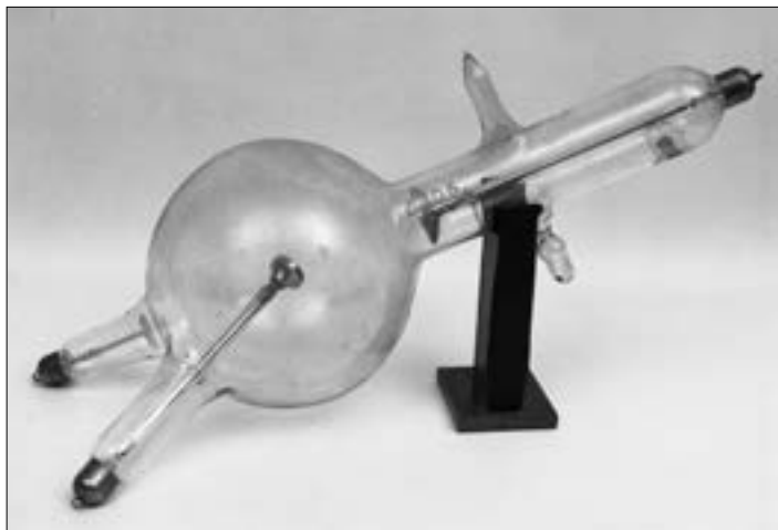
Il. 8. Lampa rentgenowska A.E.G, nr seryjny 3203 (około 1910 roku); Muzeum UJ nr inwentarzowy 8559/1489/V.

ułatwić sobie rozpoznanie, należy koniecznie dawne systemy połączyć z badaniami za pomocą promieni Roentgena, przez co zyskuje ogromnie dyagnostyka lekarska 38 .