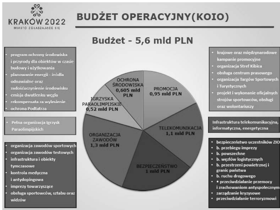
Rysunek 1. Podział środków w ramach budżetu operacyjnego

zł. Na rok 2014 rząd zaplanował 12,8 mln zł, samorządy – 10,7 mln zł, Kraków – 3,9 mln zł. W roku 2015 rząd miał przeznaczyć kwotę 10,6 mln zł, samorządy – 8,3 mln zł, a Kraków – 3 mln zł. Dodatkowo planowane było pozyskanie 30 mln zł od sponsorów. Koszty Krakowa stanowiłyby zatem 15,4%, a pozostałych interesariuszy 84,5%. Planowany budżet operacyjny wyniósł 5,6 mld zł, z czego 0,2 mld zł ponosiłyby samorządy, w tym Kraków, a 0,1–0,6 mld zł sponsorzy. W konsekwencji budżet centralny wydatkowałby 1,8 mld zł, a 3 mld zł MKOI. W sumie obiekty sportowe i pozasportowe kosztowałyby 1,69 mld zł, a infrastruktury – 15,1 mld zł. Udział poszczególnych podmiotów byłby następujący: 4,52% stanowiłyby koszty miasta Krakowa, natomiast pozostałe 95,48% kosztów (obiekty i koszty organizacyjne) ponieśliby pozostali partnerzy. Środki z budżetu operacyjnego miały zostać przeznaczone na realizację zadań w zakresie: ochrony środowiska – 0,605 mld zł, promocji – 0,95 mld zł, organizacji igrzysk paraolimpijskich – 0,52 mld zł, telekomunikacji – 1,1 mld zł, organizacji zawodów – 1,3 mld zł oraz bezpieczeństwa – 1 mld zł (łącznie koszty to 5,6 mld zł). Podział środków został zaprezentowany na rysunku 1.