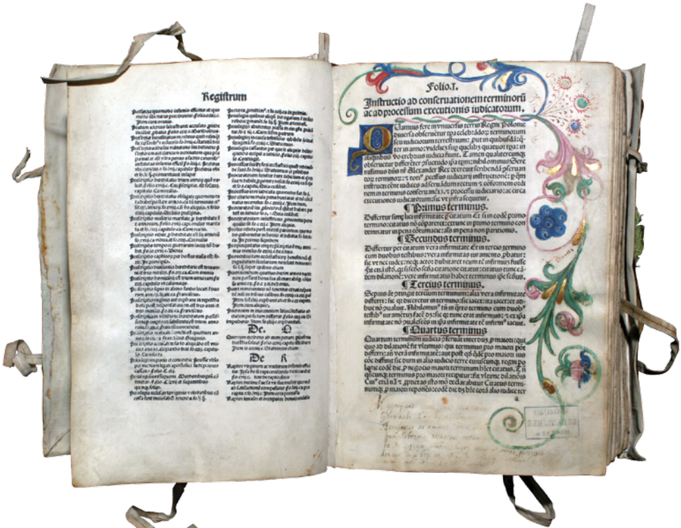
II. 2. Karta z iluminowanym inicjałem i floraturą pochodząca z pergaminowego wydania tzw. Statutu Jana Łaskiego, 1506