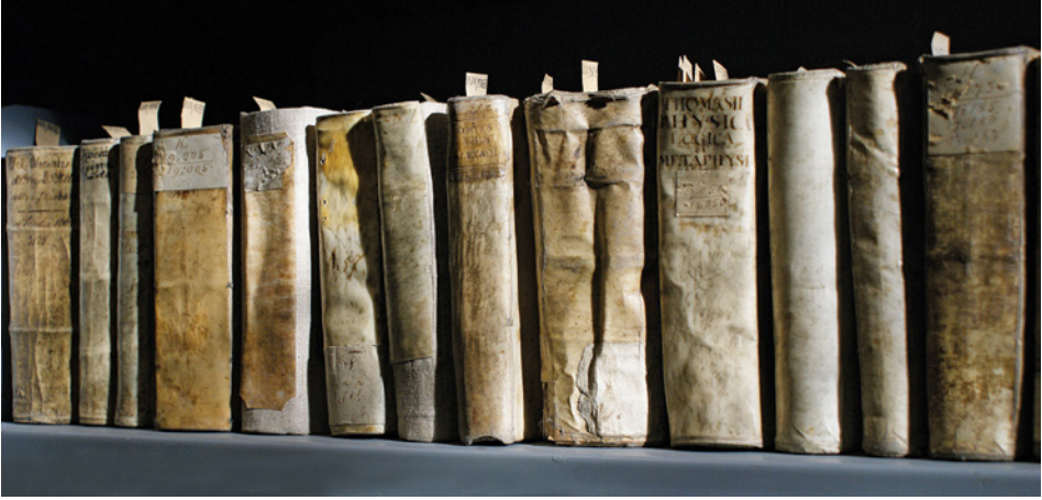
II. 1. Stare druki