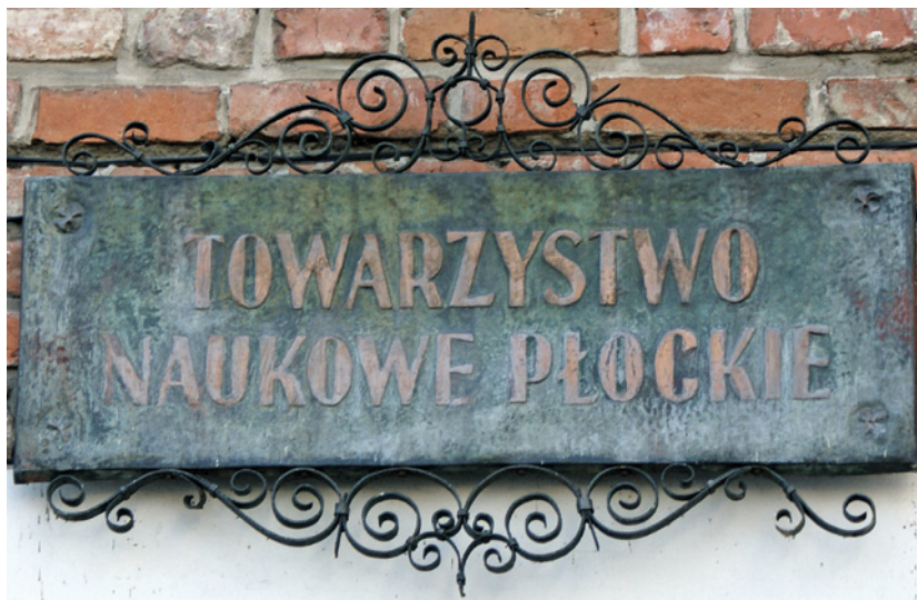
II. 4. Tablica nad wejściem do zabytkowej XV-wiecznej siedziby TNP

Wśród najważniejszych cimeliów TNP należy wymienić: pergaminową kartę z rękopiśmiennej Biblii (IX w.), tzw. Statut Jana Łaskiego – pergaminowe wydanie z 1506 r., pierwodruk dzieła De revolutionibus orbium coelestium Mikołaja Kopernika (1543), pionierski traktat dotyczący budowy rakiet Artis magnaе artilleriae Kazimierza Siemienowicza (1650), jedyny kompletny zestaw 80 grafik Los Caprichos Franciscą Goi z pierwszego wydania (1799) czy XVI-wieczne kroniki Marcina Bielskiego, Marcina Kromera i Macieja Miechowity. Zbiory liczące ponad 400 tys. jednostek (stan na 31.12.2019) są przechowywane w dwóch zabytkowych budynkach – w tzw. Domu pod Opatrznością oraz w XV-wiecznej siedzibie Towarzystwa, która znajduje się na „Europejskim Szlaku Gotyku Ceglanego” i należy do najstarszych budynków w Płocku.