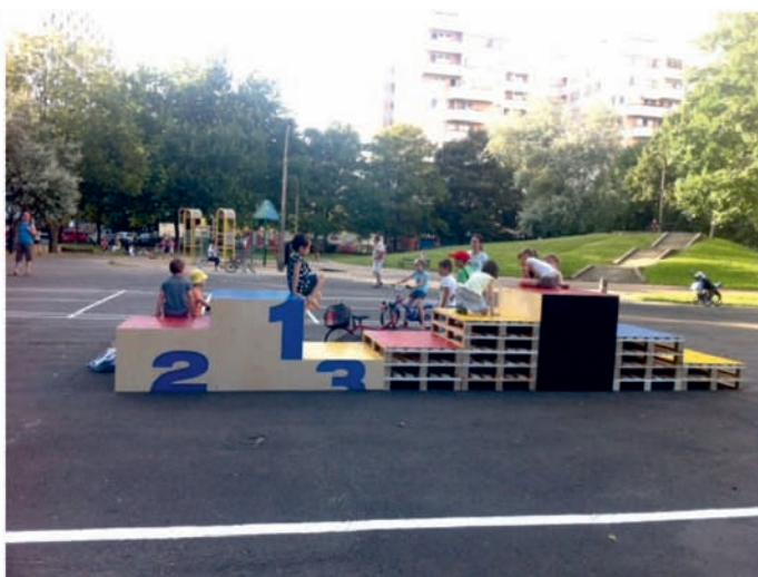
Il. 7. Realizacja Placu Górka – gry plenerowe i meble miejskie; / Realization of Górka Square – outdoor games and street furniture