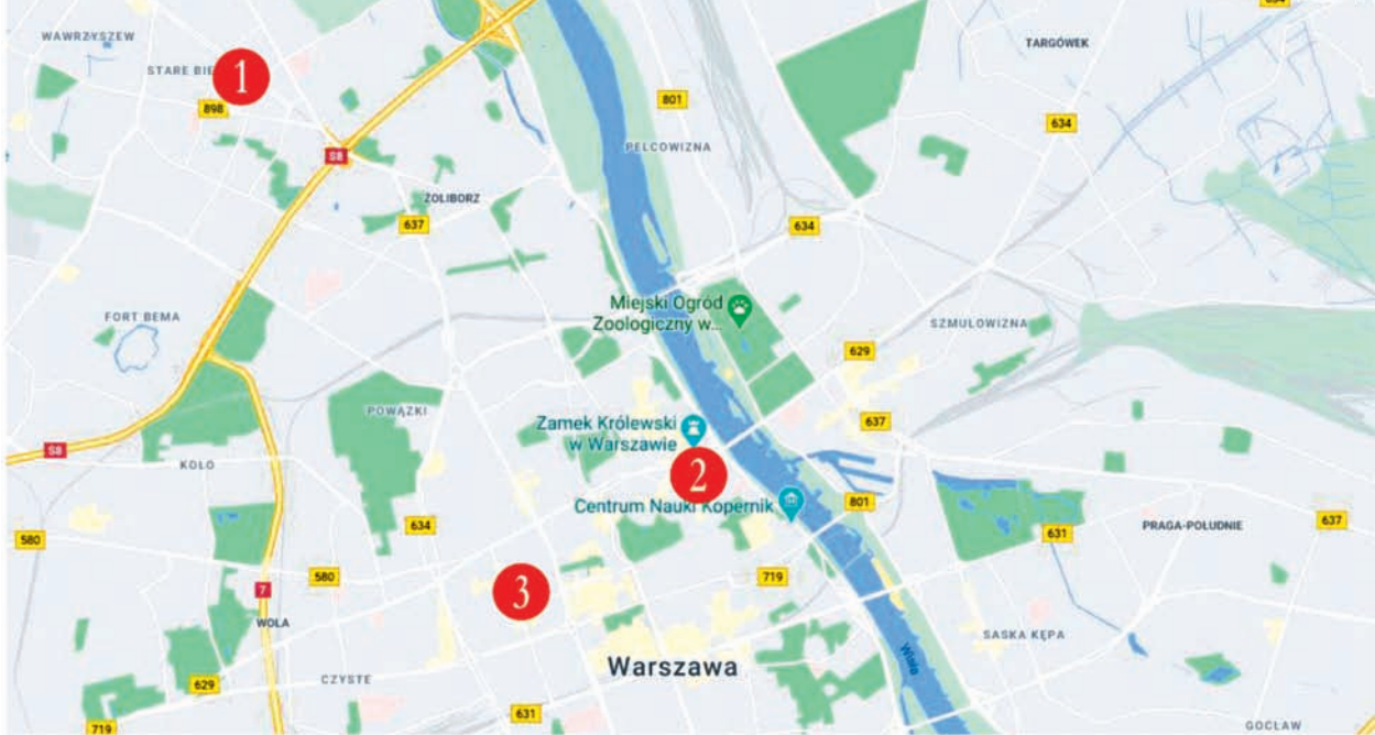
Il. 1. Lokalizacja prezentowanych przypadków na mapie Warszawy. 1 – ul. Żeromskiego, 2 – Rynek Mariensztacki, 3 – ul. Krochmalna; Autor: Anna Cudny / Location of cases on the map of Warsaw: 1 – Żeromski Street, 2 – Mariensztat Square, 3 – Krochmalna Street; Author: Anna Cudny

pochodzącego z wewnątrz, bądź z zewnątrz grupy przed podjęciem działań opisanych w tym opracowaniu. Także można przyjąć, że wyjściowy kapitał społeczny grup był podobny we wszystkich trzech przypadkach.