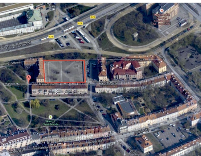
Il. 9. Fontanna na Rynku Mariensztackim; źródło: Anna Cudny / The fountain at the Mariensztat Square; źródło: Anna Cudny