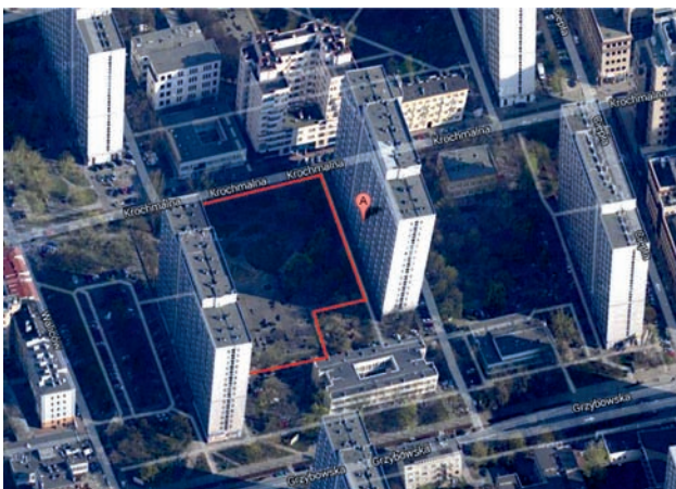
Il. 6. Podwórko przy ul. Krochmalnej – widok na górkę; źródło: Anna Cudny / Courtyard at Krochmalna Street - view to hill; źródło: Anna Cudny