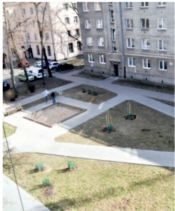
Il. 3. Podwórkó przy ul. Żeromskiego – widok na część wschodnią; / Courtyard at Żeromski Street - view to the eastern part