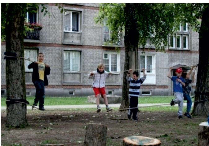
Il. 4. Realizacja tymczasowego Letniego Placu Zabaw – mini park linowy i plenerowe gry planszowe; / Realization of the Temporary Summer Playground - mini rope park and outdoor board games

The statements of the youngest were a repetition of their parents' conversations. And the pressure exerted by adults and their claims regarding the spatial solutions made the children feel inferior to their peers from other yards; they felt deceived by the project's realisation. The animators told the children that if they did not like the temporary playground, they could dismantle it, but everyone had to be aware that they would not be getting anything