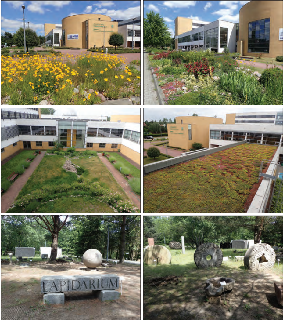
Fot. 1. Elementy zagospodarowania przyrodniczego Wydziału Nauk Geograficznych i Geologicznych

Photo 1. Elements of the natural development of the Faculty of Geographical and Geological Sciences