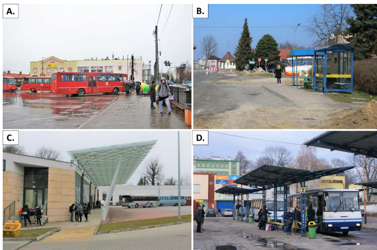
Ryc. 4. Miejsca odjazdów autobusów PKS: A. – dworzec PKS w Leżajsku, B. – przystanki przy ul. Słowackiego w Lubaczowie, C. – Centrum Komunikacji Miasta Łącuta, D. – dworzec PKS w Przeworsku.

Na tle całej próby zdecydowanie najlepiej wypada Centrum Komunikacyjne Miasta Łącuta, jako nowa inwestycja uwzględniająca liczne udogodnienia dla pasażerów. Budynek wraz z otoczeniem wyposażony jest we wszystkie elementy infrastruktury poddane analizie, w tym te zdaniem autora najbardziej istotne – m.in. poczekalnię, toalety, kasę biletową oraz informację. Całkowicie zadaszone stanowiska odjazdowe położone bezpośrednio w sąsiedztwie budynku poczekalni umożliwiają komfortową wymianę pasażerską bez względu na warunki pogodowe.