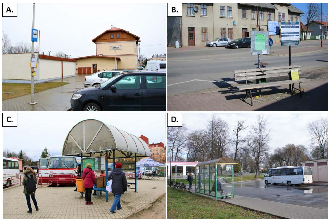
Ryc. 3. Miejsca odjazdów przewoźników prywatnych: A. – w Leżajsku, B. – w Lubaczowie przy ul. Kolejowej, C. – w Łączu przy pl. Cetnarskiego, D. – przystanek Przeworsk MOK.

Istnieje różnica w poziomie jakości dworców autobusowych względem miejsc odjazdów przewoźników prywatnych na zdecydowaną niekorzyść tych drugich. We wszystkich omawianych miastach miejsca odjazdów przewoźników prywatnych zorganizowane są w sposób nieuwzględniający podstawowych potrzeb pasażerów, a w większości wręcz niebezpieczny (ryc. 3). Zgodnie z przyjętą klasyfikacją, wszystkie przystanki przewoźników niezależnych spełniają jedynie kryterium funkcjonalne (jako miejsca wsiadania i wysiadania pasażerów) oraz organizacyjno-techniczne – zmiany kierunku jazdy. Z punktu widzenia pasażera nie ma więc różnicy pomiędzy przystankiem początkowym a pozostałymi przystankami na trasie. Jedynie przystanek w Łączu posiada wydzielone technicznie perony zapewniając bezpieczeństwo wsiadających pasażerów; przystanki w Przeworsku oraz Leżajsku wymuszają obsługę pasażerów bezpośrednio z placu parkingowego bądź manewrowego. Spośród miejsc odjazdów przewoźników prywatnych,