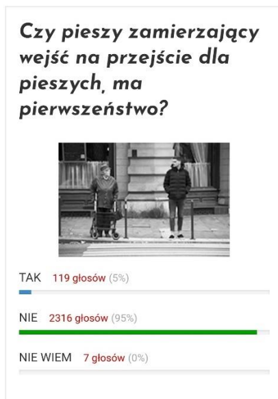
Ryc. 2. Wynik ankiety autorstwa czasopisma Prawo Drogowe News 26 .

Z powyższą interpretacją zgodne są wyniki ankiety czasopisma Prawo Drogowe News (ryc. 2).