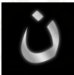
Grafika 2. Arabska litera nun w kampanii internetowej

W mediach społecznościach zrodziła się kampania, w ramach której przekazywana była arabska litera nun . Użytkownicy zmieniali nawet całe awatary na ten symbol. Działalność ta miała być ich oporem przeciw prześladowaniom chrześcijan w Iraku. W miejscowości Mosul dżihadyści pisali ten symbol na drzwiach chrześcijańskich rodzin. Nun jako 14. znak alfabetu arabskiego nawiązywał do Nazarejczyków, czyli chrześcijan tak nazywanych przez islamistów. W mediach społecznościowych użytkownicy dzielili się tym hashtagiem niezależnie od własnego wyznania.