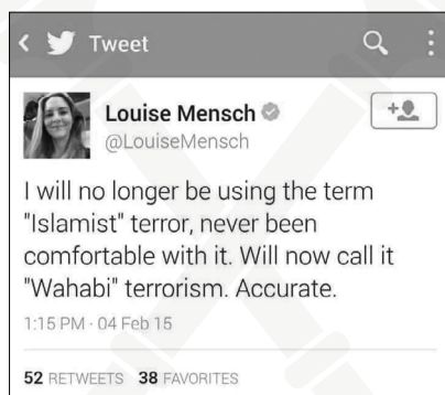
Grafika 1. Wpis na Tweeterze dotyczący terminu „islamski”

Wśród globalnych hashtagów skupiających internautów wokół konkretnych problemów powstał między innymi grupujący doniesienia dotyczące zbrodni dokonywanych w Iraku oraz Syrii przez tzw. Państwo Islamskie, skrócony do #ISIS. Gdy pojawiały się doniesienia dotyczące nowego ataku na osobę lub grupę ludzi w tamtej części świata, w social media wybuchała dyskusja. Powstały również alternatywne hashtagi, przez które użytkownicy chcieli przekonać, że założenie islamskiej religii jest przeciwieństwem działalności terrorystycznej. W ich rozumieniu używanie terminu „islamski” może być mylące.