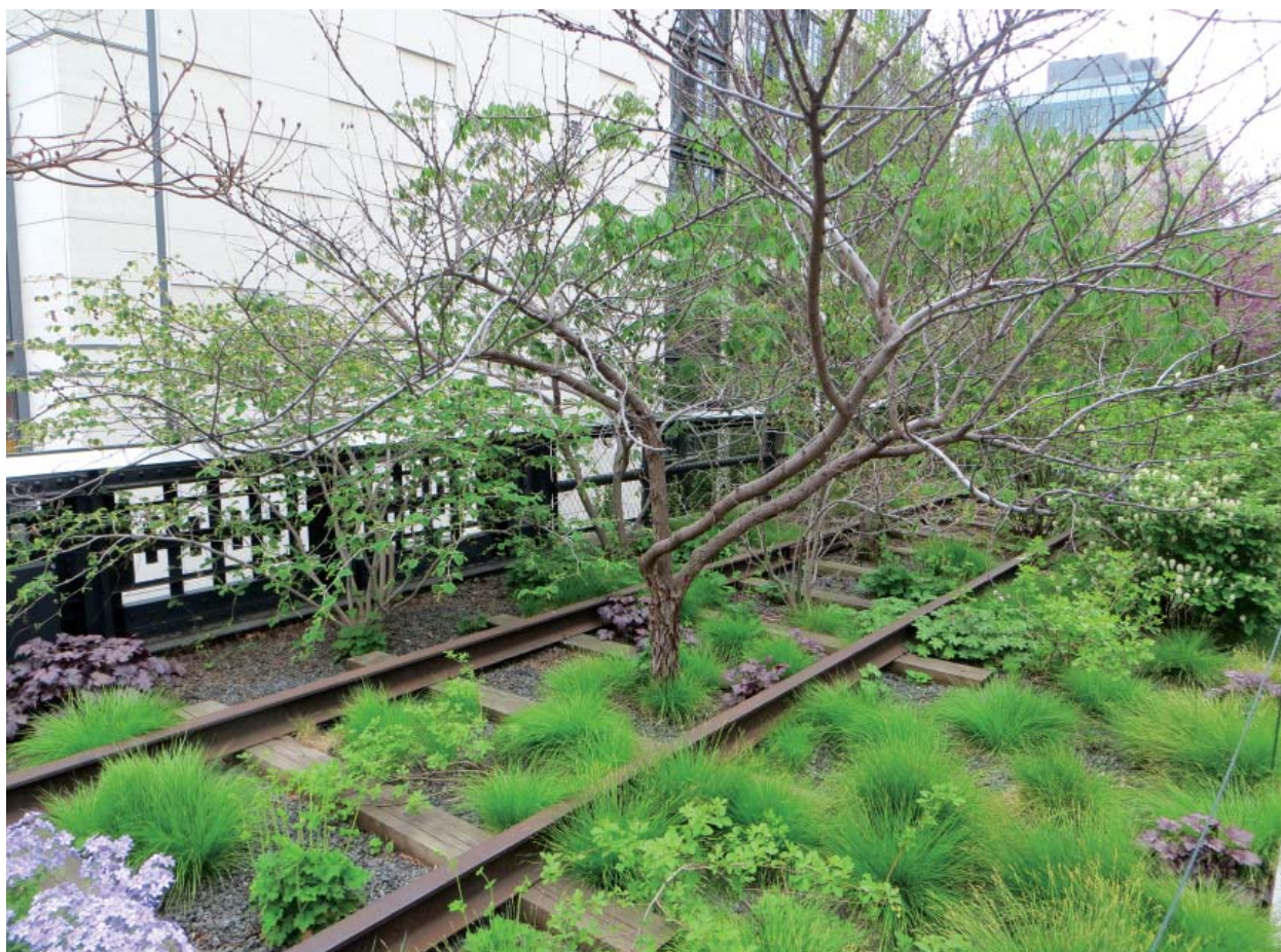
High Line Park