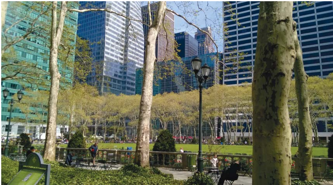
Bryant Park